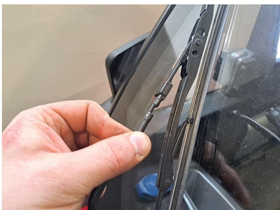
Ota tuulilasin pesurin letku irti.